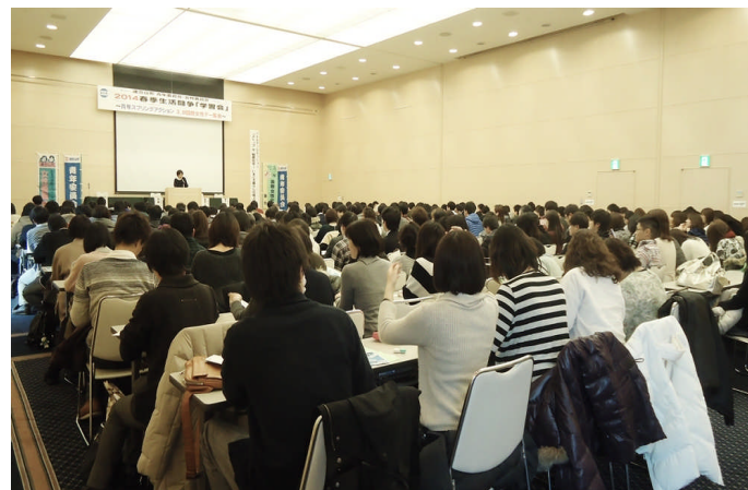
写真: 3月8日 連合山形 国際女性デー